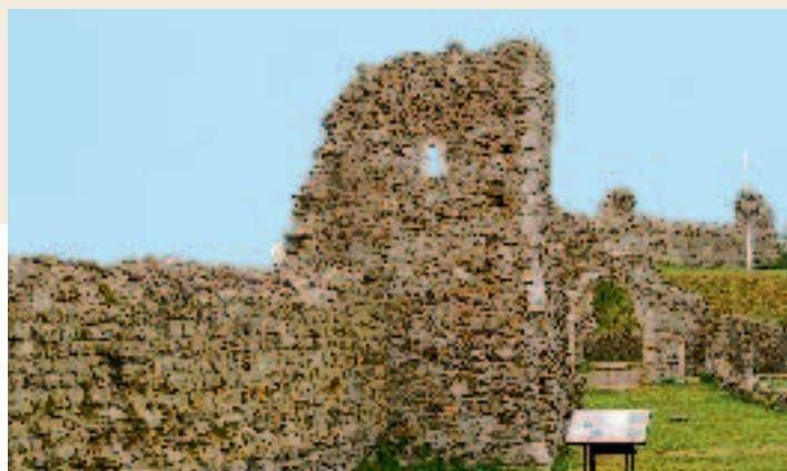
El Castillo de Hastings

Las autopistas que unen Londres con Brighton y Dover han permitido su incremento económico. A pesar de ello, las tierras de esta zona conservan emplazamientos históricos de acontecimientos que influyeron en el porvenir de Inglaterra. En su amplia campiña hay una multitud de castillos lujosos que abren sus puertas al público en verano y sus costas tienen dramáticos y altos acantilados protegidos por el "National Trust" (sociedad estatal para la conservación de emplazamientos y monumentos).