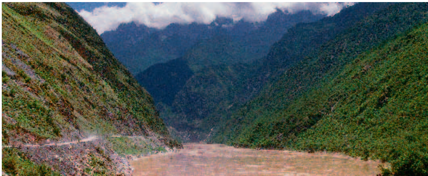
Valle del Tigre Saltarín