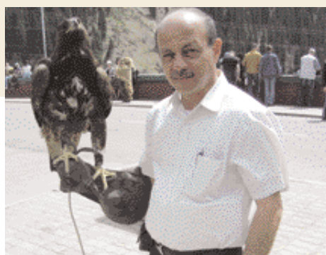
El autor con un halcón domesticado الكاتب مع صقر أليف

En cuanto sales de su aeropuerto internacional te sorprende la ciudad de Alma-Ata (palabra que significa 'Paraíso de las manzanas') con sus grandes y altos árboles a lo largo de sus anchas carreteras, que te dan la impresión de encontrarte en un bosque constituido hace más de 150 años. Antes, era Alma-Ata capital de la República de Kazajstán, pero en 1 997 la capitalidad pasó a la ciudad de Astana, situada en medio del país. Cabe destacar que Kazajstán es el noveno país más grande del mundo en superficie y que la manzana es el símbolo del Estado.