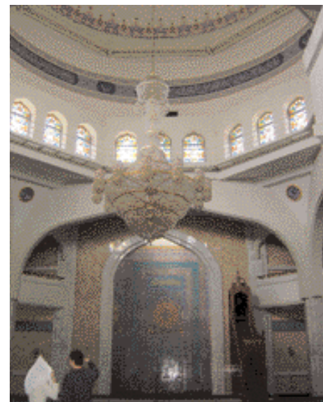
Mezquita Central Yumua مسجد الجمعة المركزي

Al final nos dirigimos a los montes que rodean Alma-Ata. La espesura de los árboles es realmente impresionante. En lo alto de la montaña se ha construido una estación de esquí. Se sabe igualmente que Kazajstán (al igual que la antigua Unión Soviética) le otorga una gran importancia a los deportes, al punto que tiene un 'Ministerio de Turismo y Deportes'. Y es Kazajstán el país que organizará