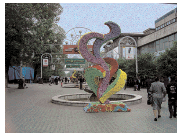
Plaza embellecida con colores ساحة مزندانة بالألوان

en su territorio los Juegos Asiáticos de 2011. Uno de los deportes preferidos es el motociclismo. Y el guía que me acompañó me indicó que los kazajos aman mucho la pesca, lo que podría animar a los turistas árabes a disfrutar en este país de este deporte. Algunas antiguas costumbres son alegres y bonitas: por ejemplo, la novia, el día anterior a su boda, debe efectuar carreras en la Plaza de la Independencia, ante el público y con su traje de boda, quizás para demostrarle a su novio y a la familia de éste que es fuerte, sana y capaz de servir a su marido y de realizar las tareas domésticas.