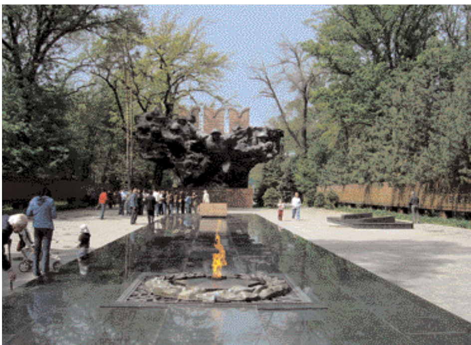
Estatua del Soldado Desconocido