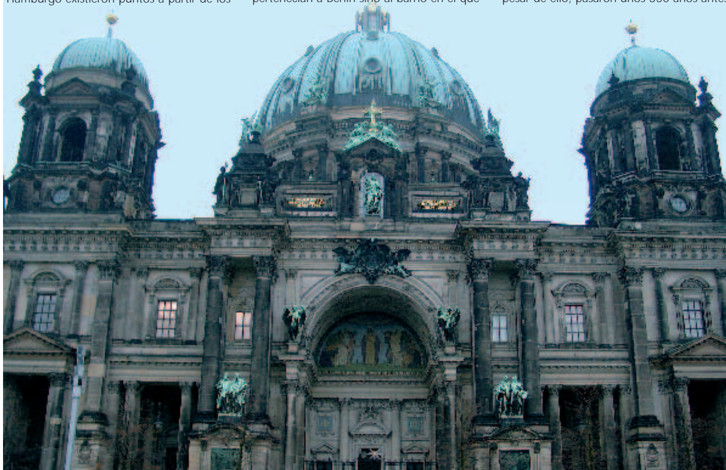
La cúpula Berliner

vivían. La historia de la ciudad (situada a las orillas del Spree) comenzó en 1307, cuando los dos pueblos llamados Berlín y Cölln (en esa época Cölln era el más grande) construyeron un ayuntamiento común. A pesar de ello, pasaron unos 350 años antes ▶