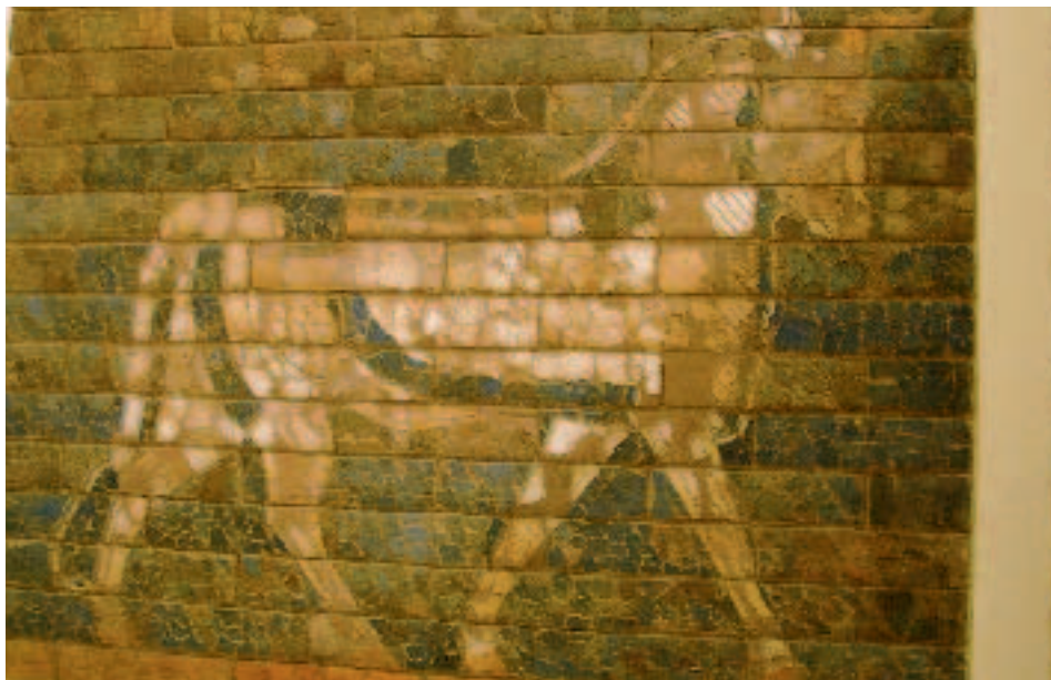
Detalle de la Puerta de Ishtar de Babilonia