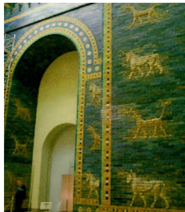
La Puerta de Babilonia