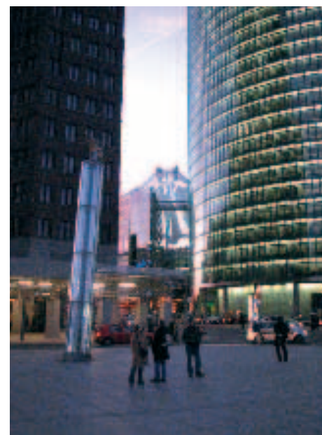
El Centro Sony