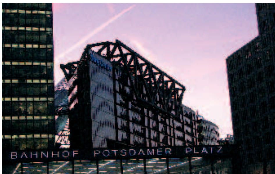
La recién construida Plaza Potsdamer