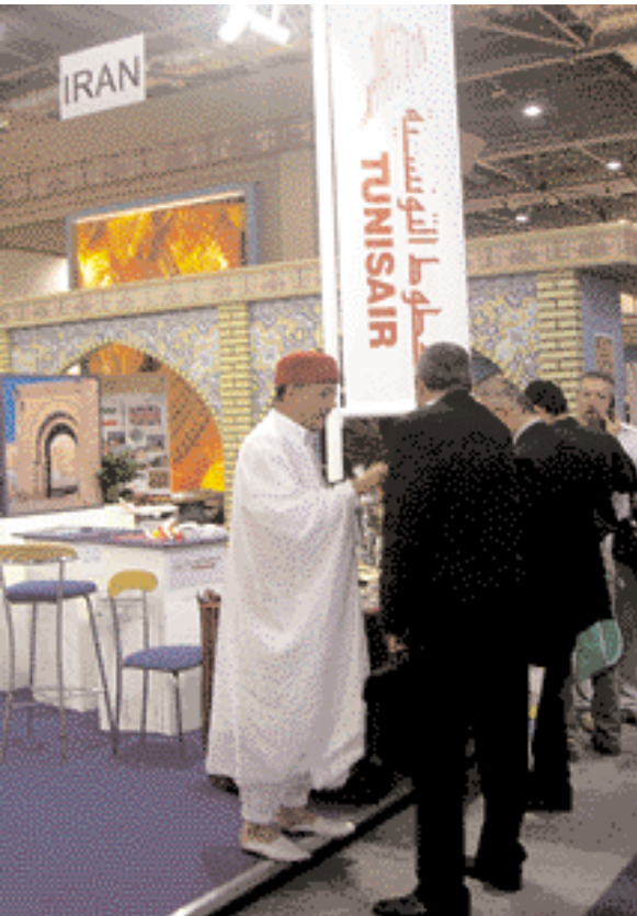
En el interior de la exposición