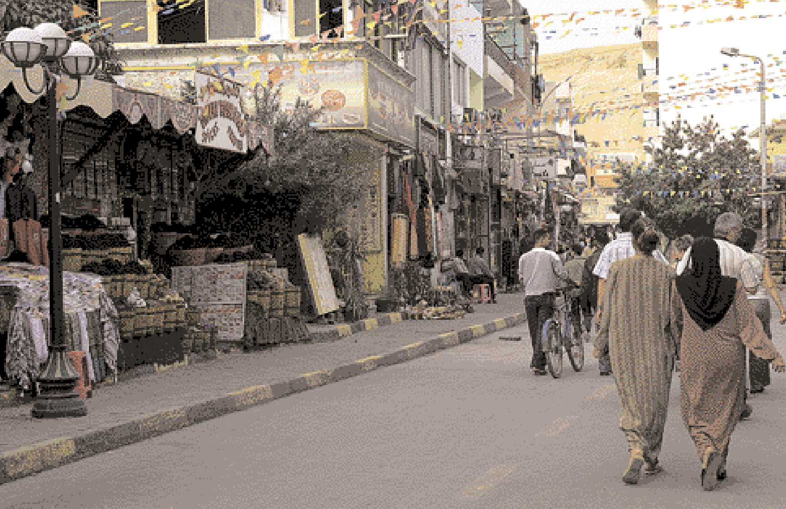
Tiendas pequeñas en una calle de Ad-Dahar