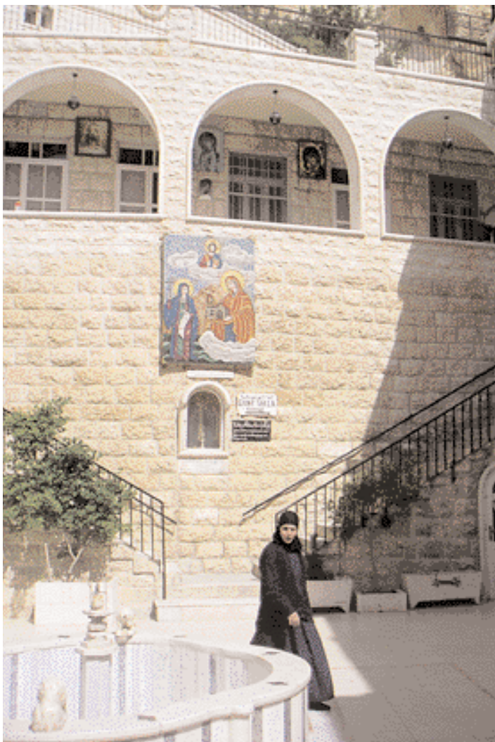
Religiosa en el convento Mar santa Tecla

Las dos ciudades, Saydnaya y Maalula, son muy visitadas por turistas locales e internacionales, las dos están incluidas en las jiras turísticas y las dos merecen ser visitadas. Su rica historia, su particularidad religiosa, su extraordinaria situación geográfica y la hospitalidad de sus habitantes han hecho de ellas dos sitios inolvidables de Siria. Representan, en todo caso, la riqueza cultural y religiosa de la sociedad siria actual y símbolos únicos de la civilización humana. ■