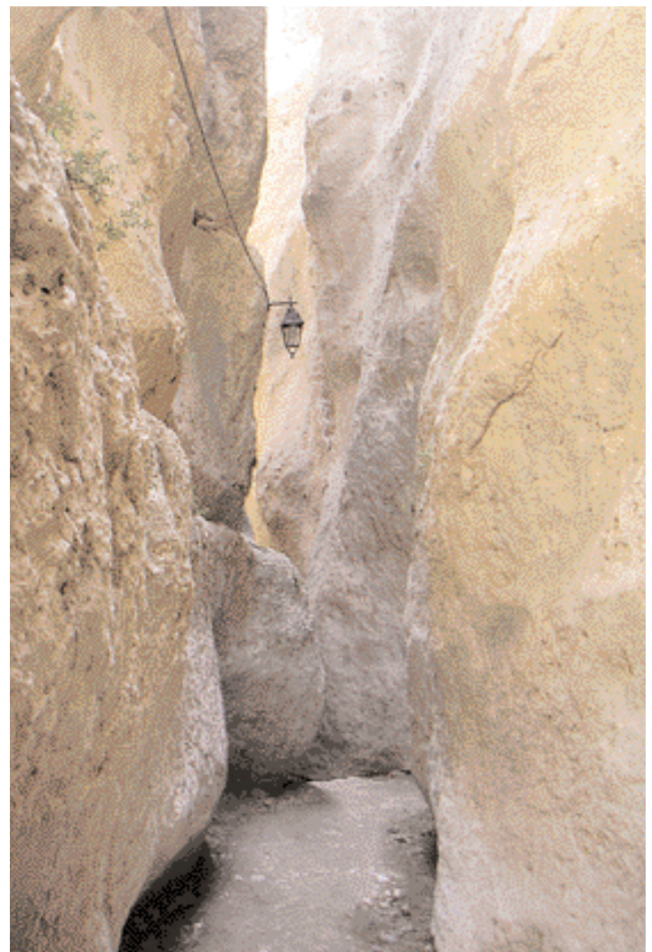
El desfiladero de Maalula