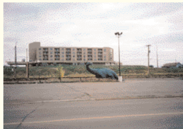
Drumheller, la capital de los dinosaurios