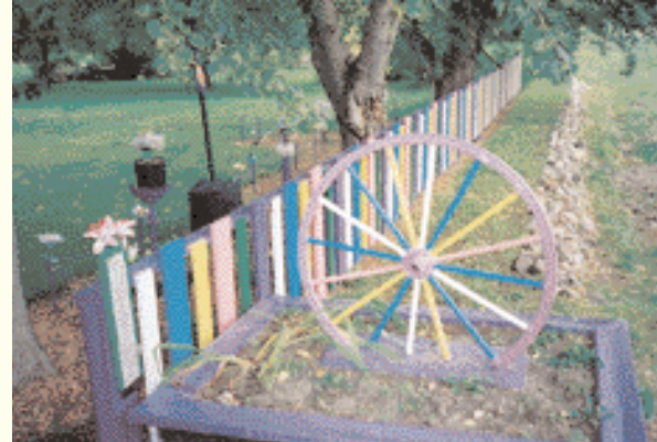
Big Valley, la ciudad del tren a vapor