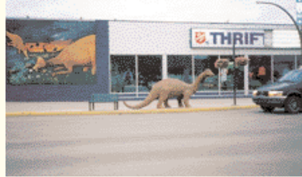
Drumheller, la capital de los dinosaurios

Los mapas que se venden en Londres indican que la región de Badlands tiene varias pequeñas y atractivas ciudades como Rose Lynn, Sherness, Dorothy y Sunnynook. Pero la realidad sobre el terreno es algo diferente: lo único que queda de Rose Lynn es una casa rural abandonada, con un