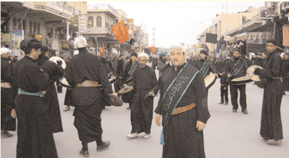
Los tambores determinan el ritmo de la procesión