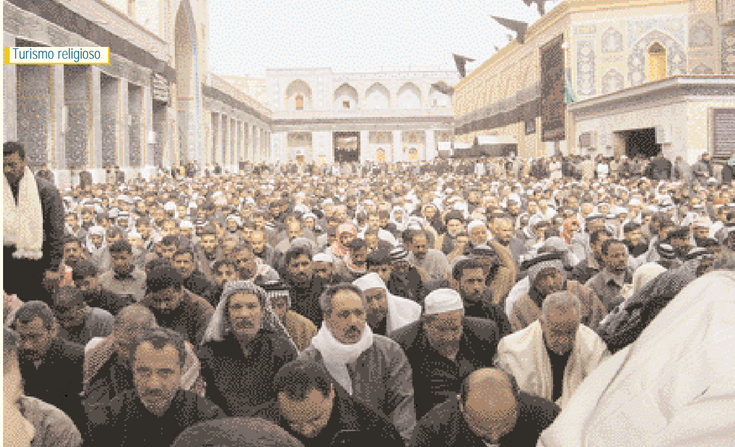
Visitantes escuchando la historia del martirio de Al-Hussein en el mausoleo الزوار يستمعون إلى قصة مقتل الإمام الحسين (ع) داخل الصحن الحسيني الشريف صبيحة يوم عاشوراء