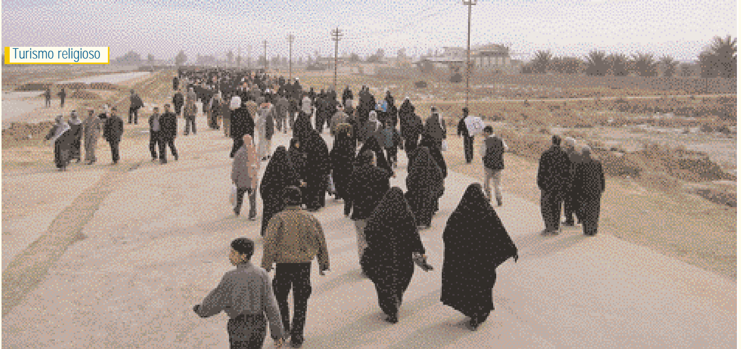
Grupos de peregrinos yendo a pie a Kerbala

مجاميع من الزوار تتجه مشياً على الأقدام إلى كربلاء