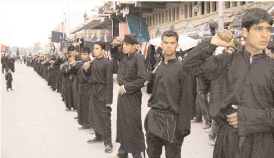
Preparándose los 'zanayil'