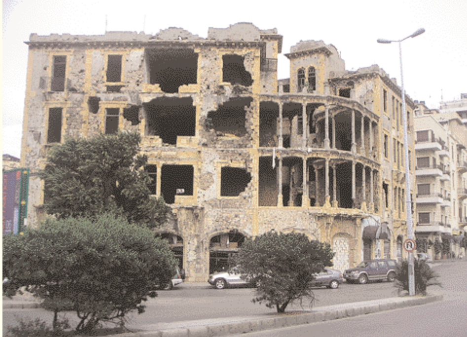
Testigos de la guerra civil

Algunos pocos ejemplos intentan combinar las construcciones modernas con el modelo