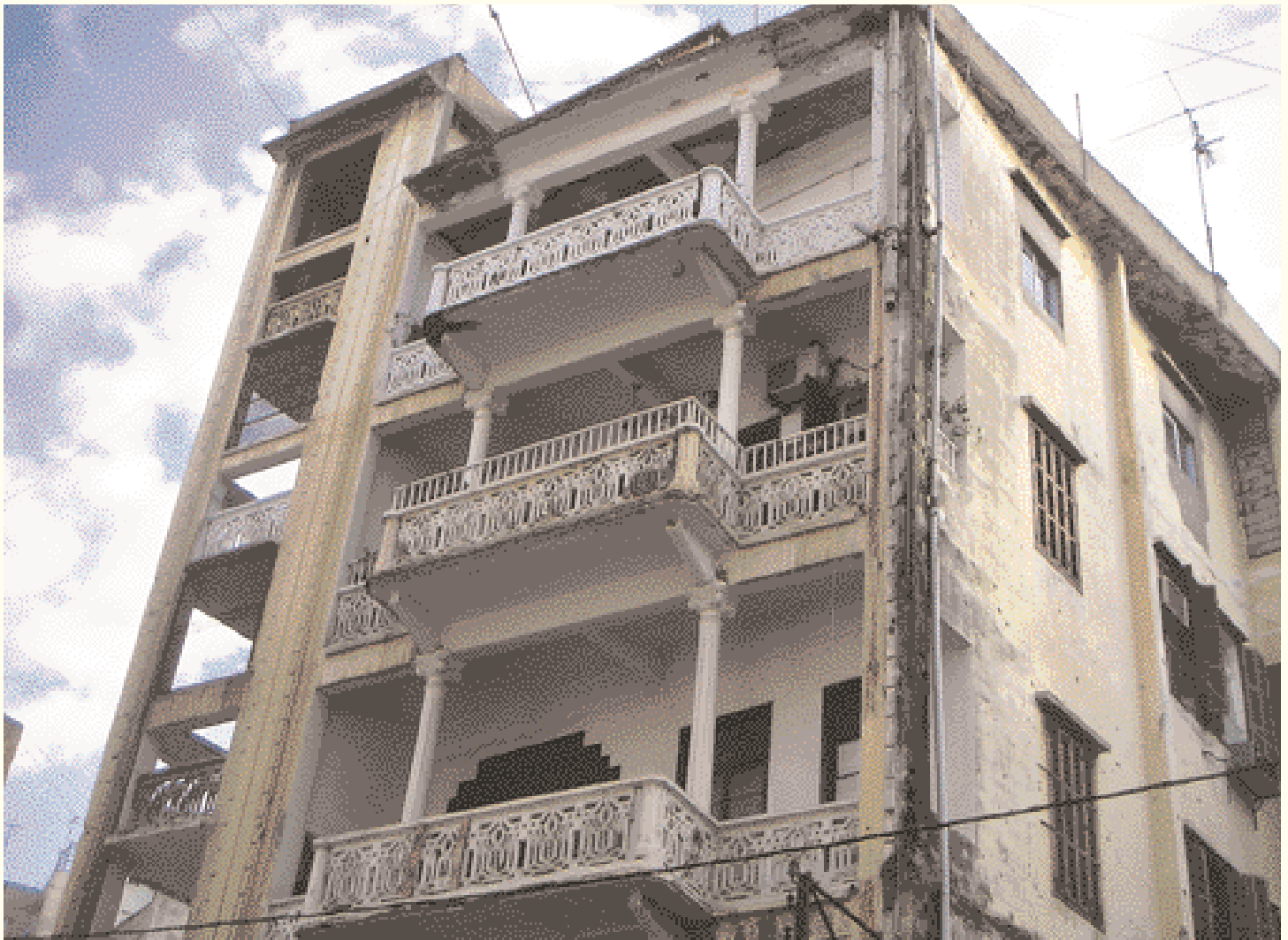
Edificio antiguo habitado, con espléndidas verandas