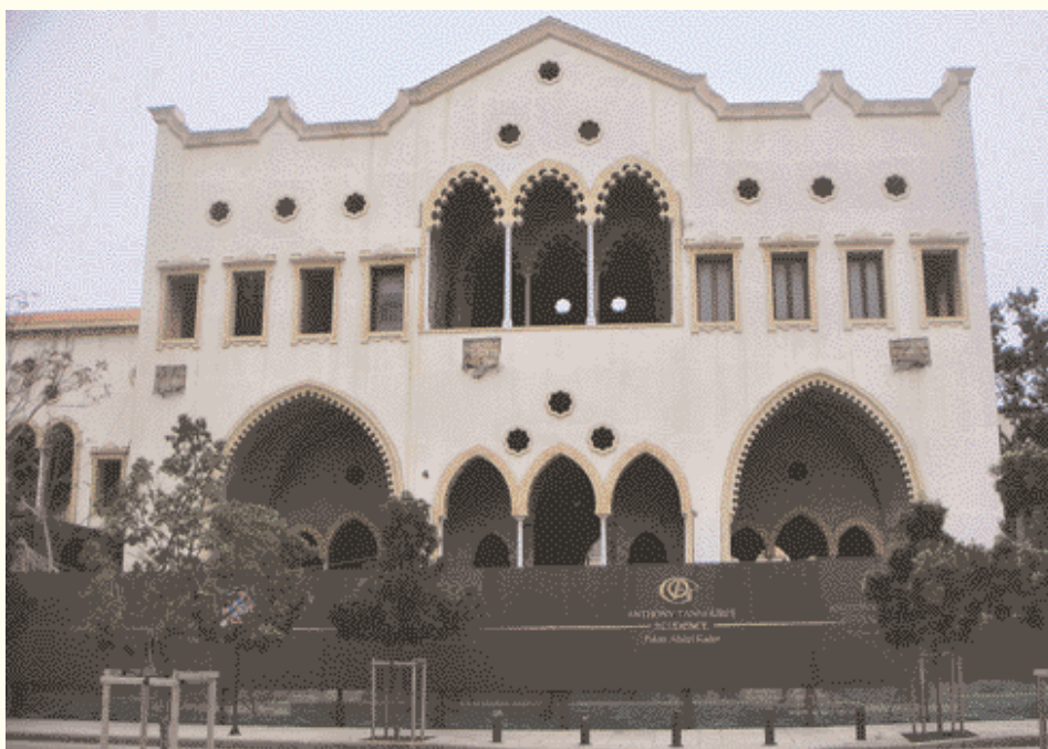
Restaurando el patrimonio arquitectónico