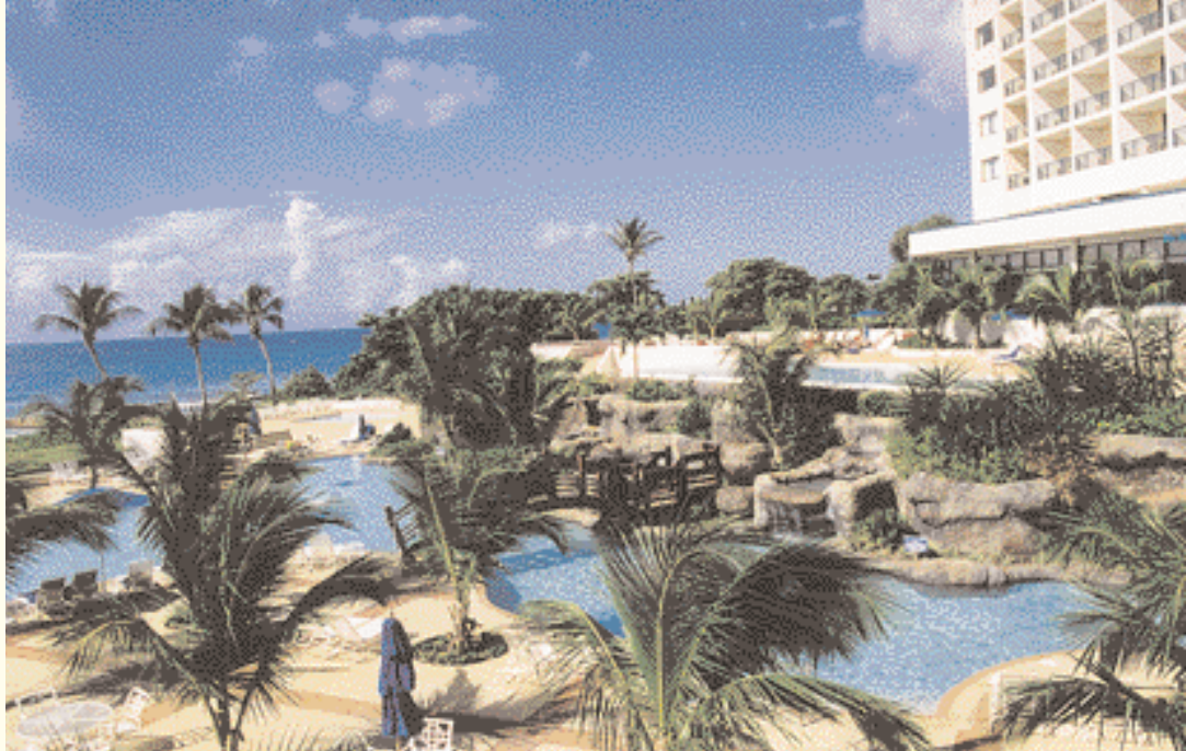
En el Hotel Hilton, por la mañana temprano

De nuevo cerca de la carretera, visitamos Cobblers Cove, un grandioso hotel nuevo, con