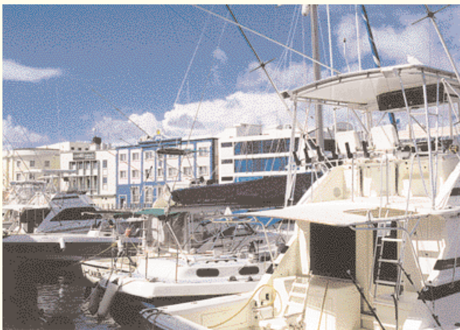
Yates en el puerto de Bridgetown