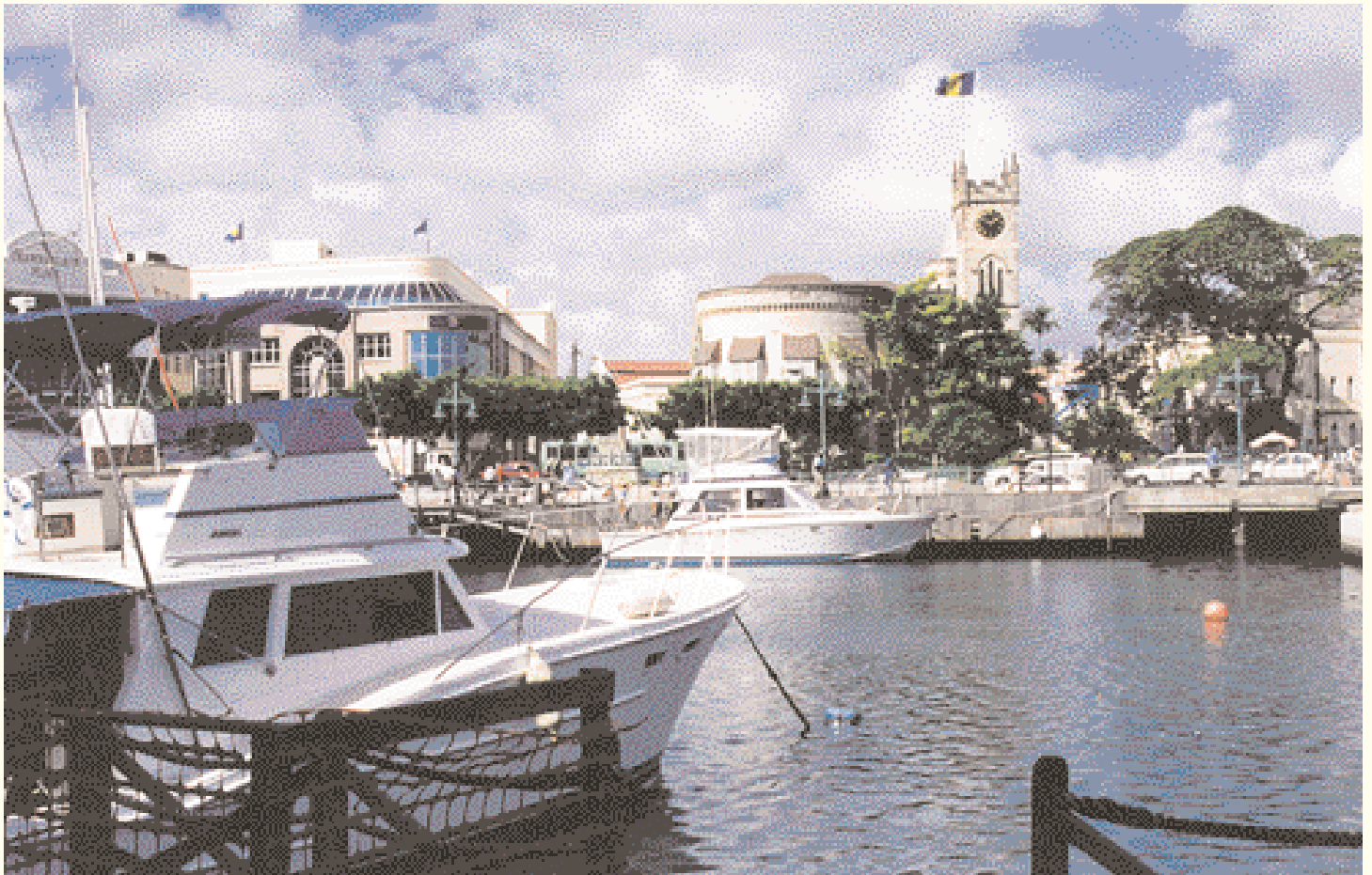
Yates en el puerto de Bridgetown

En el siglo XVII los ingleses trajeron esclavos africanos a esta pequeña isla para cortar caña de azúcar. Durante ese periodo, transmitieron a los esclavos su lengua y les enseñaron sus viejas tradiciones, como jugar al polo, beber té a media tarde contemplando una partida de críquet y cosas por el estilo.