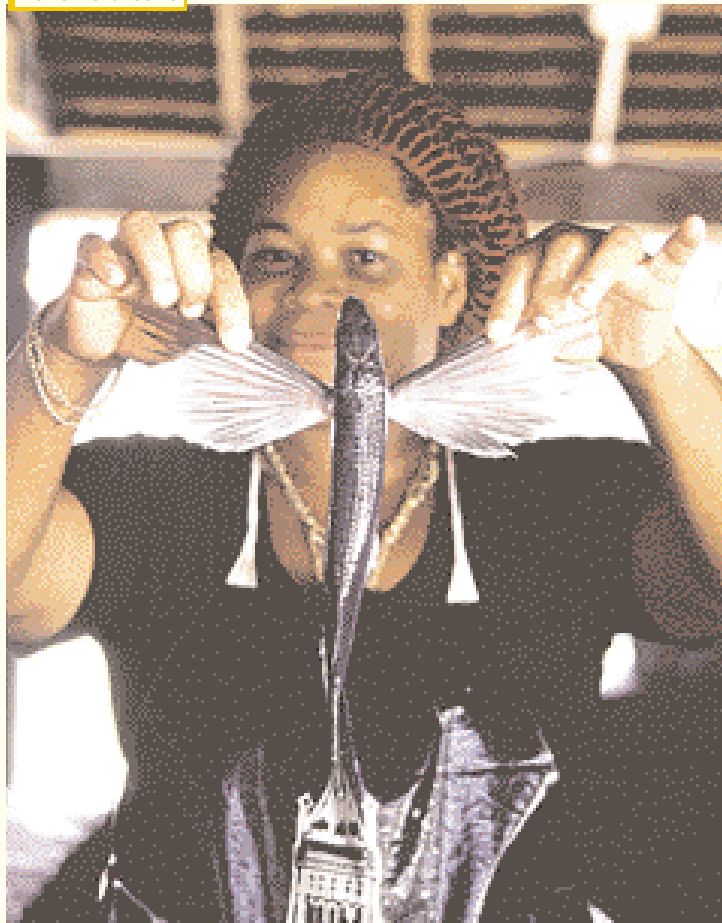
El pez volador