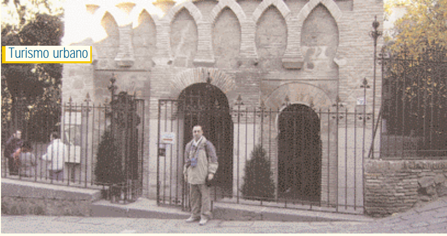
Mezquita de Bab Al-Mardoum y autor en la parte superior de la foto