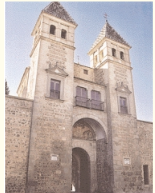
Puerta de la Bisagra