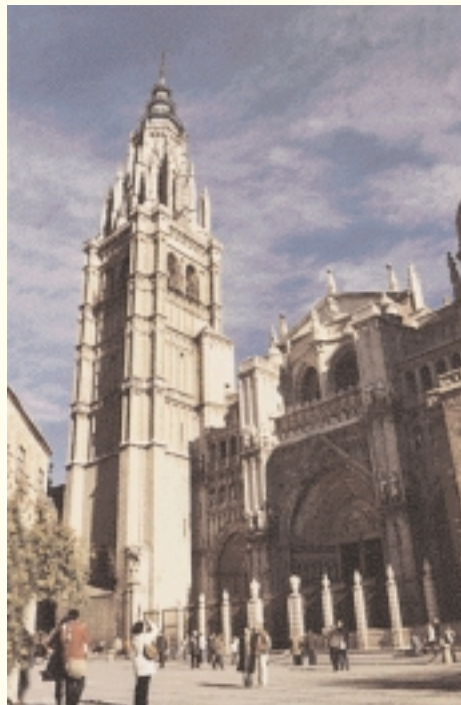
Catedral de Toledo

A poca distancia de esta puerta, en dirección este, hay otra puerta, llamada Puerta del Sol (Bab As-Shams en árabe). Se dice que fue construida en tiempos de Al-Mamun Dinnun, gobernador de Toledo a principios del siglo X. Es esta puerta la obra arquitectónica más bella dejada por los árabes aquí. El mérito de su permanencia se debe a las reformas que se le han practicado en los últimos tiempos. Al frente de la puerta hay un arco en forma de herradura y, encima de éste, otros arcos entrecortados de