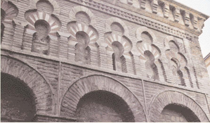
Mezquita de Bab Al-Mardoum