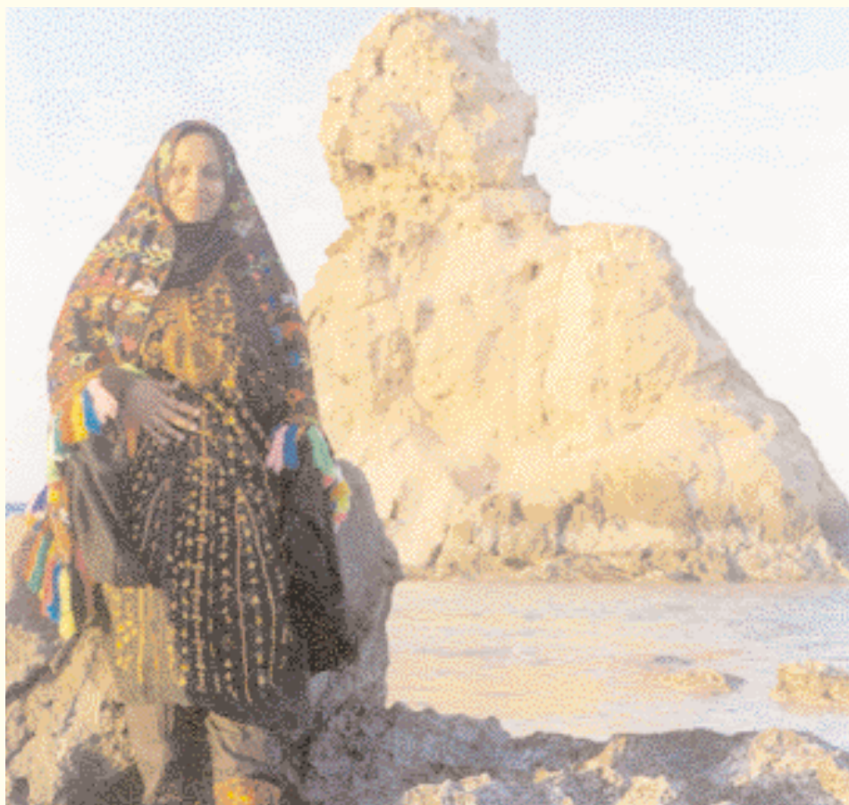
فتاة من مرسى مطروح بشاطئ حمام كليوباترا.

ministro con brusquedad, preguntando: «¿Cómo puede usted decir eso precisamente de El Alamein, que tiene uno de los campos de minas más grandes del mundo?». El ministro respondió con calma: «No se preocupe, amigo mío, no construiremos el hotel ni el aeropuerto en un campo de minas, y en un futuro próximo se confirmará lo que digo». Aceptamos a regañadientes la respuesta del ministro, pero hoy tenemos que reconocer que el señor Al-Baltagui cumplió lo prometido.