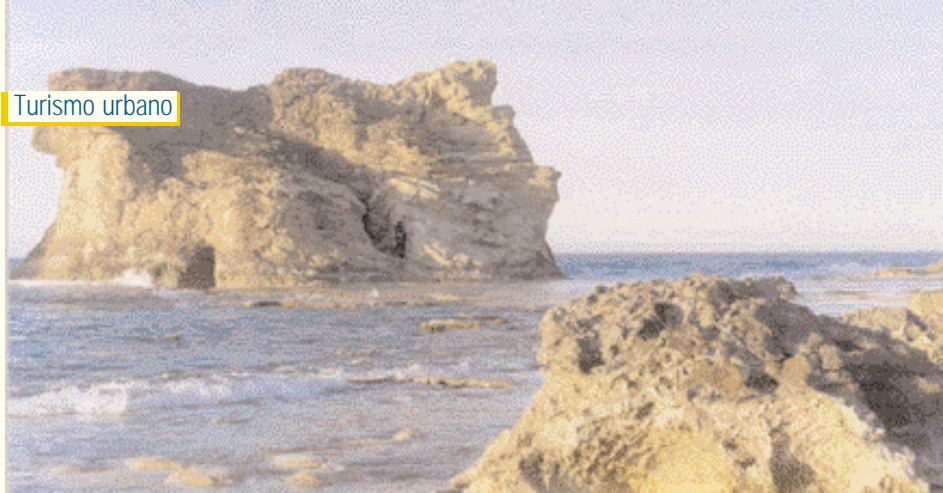
La Costa de los Baños de Cleopatra.