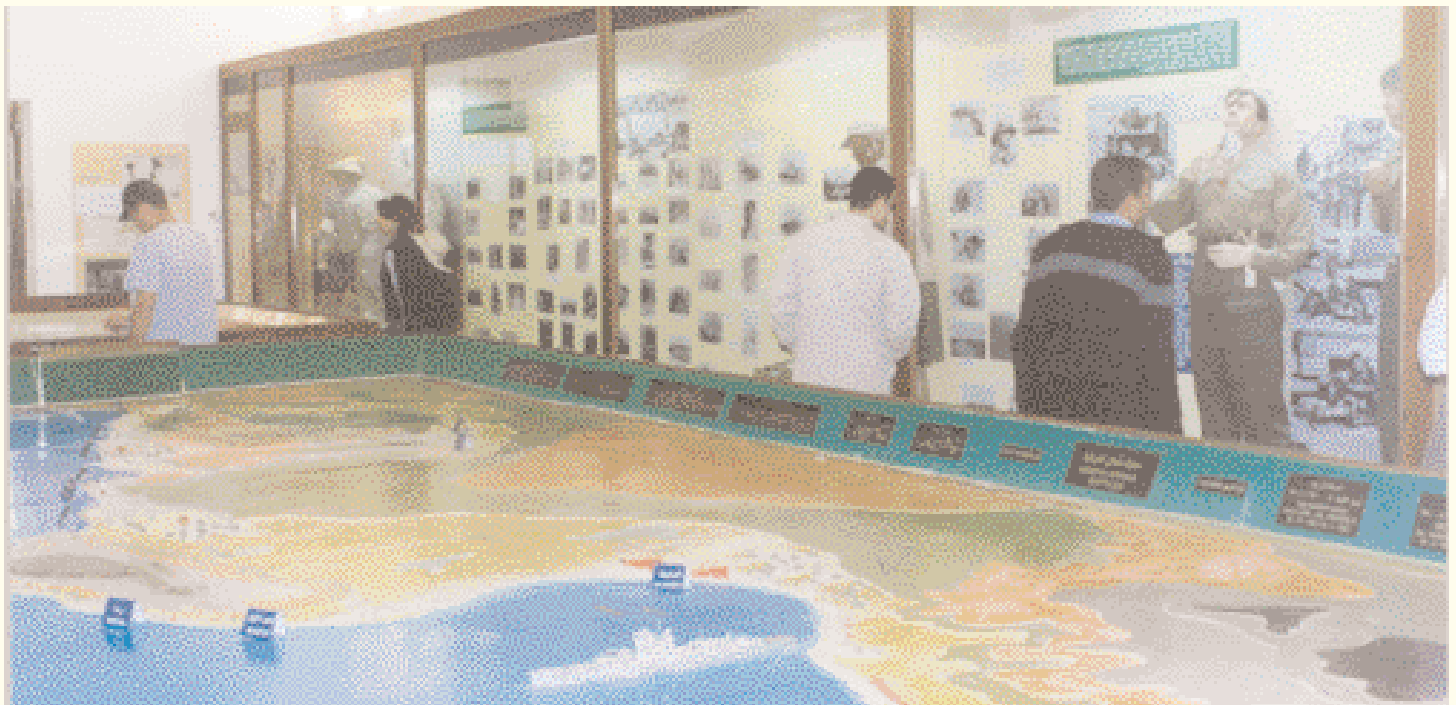
Objetos expuestos en el Museo Militar de Al-Alamein.

Los egipcios celebraron con orgullo, en la década de los 60 del siglo XX, la construcción de la Gran Presa de Asuán, pero parece que las grandes presas en Egipto se han multiplicado. La última, en el Sahel Noroccidental que da al mar Mediterráneo, ha sido la transformación de la región de El Alamein de tumba de soldados en lugar de ocio y paraíso para turistas.