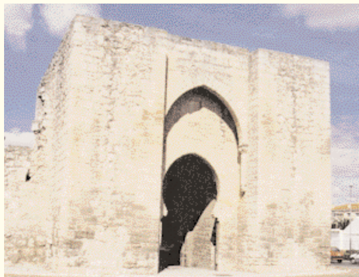
بوابة توليدو / ثيوناد ريال.

asunto principal (así algunas obras teatrales, cuyos títulos aluden al tema, por ejemplo Los tratos de Argel, Los baños de Argel, o su novela corta La gran Sultana), o como ambiente literario y lugares, personajes, expresiones e incluso palabras y señas. En El Quijote he encontrado más de 35 personajes islámicos o de cultura islámica, entre las cuales hay que contar sin lugar a dudas al personaje de Sidi Ahmet, el narrador principal de la novela, así como más de veinte proverbios populares y 220 palabras de origen árabe, sin contar las influencias históricas, literarias y religiosas».