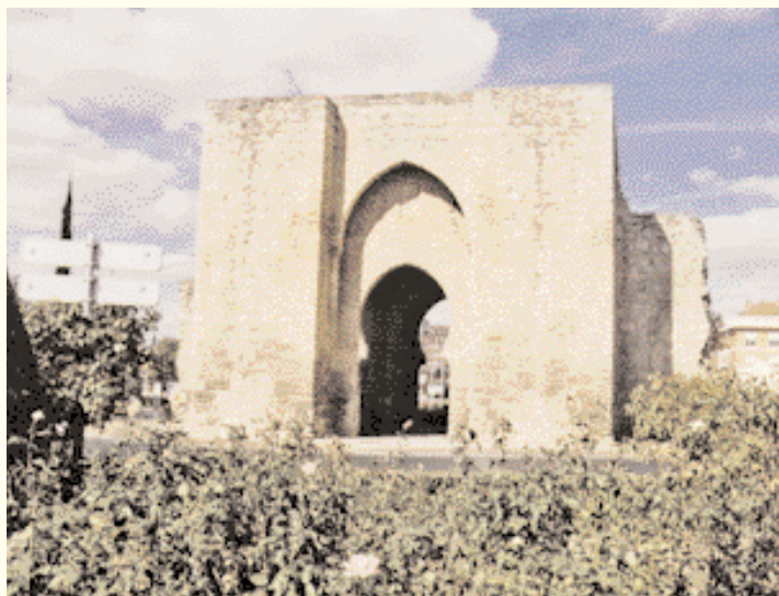
Puerta de Toledo, en Ciudad Real.