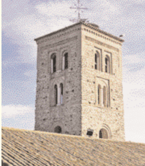
كنيسة بيتراغو / مدريد. Iglesia de Buitrago en Madrid.