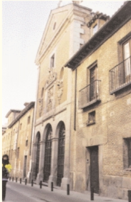
الكنيسة التي دفن فيها ثربانتس

Cuando los musulmanes conquistaron España, fundaron en esta región una guarnición militar que denominaron Kalat Abdeslam, rodeada por un profundo río, además del Henares, lo que la hacía inexpugnable y de difícil acceso. Las huellas de esta ciudadela están muy degradadas, apenas si se puede encontrar algo de interés, pues se han transformado en montones de piedras y de tierra, salvo unas pequeñas porciones de muralla y algunas torres derruidas. Las fuentes españolas