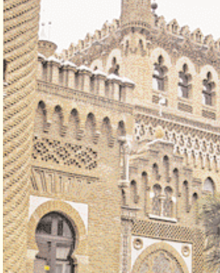
Hotel Laredo en Alcalá de Henares.