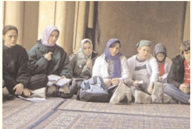
En la mezquita Ben Tolon. en el Cairo.