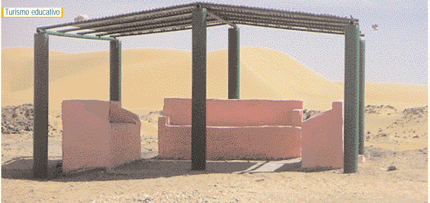
Parada de autobús para ir a las dunas.