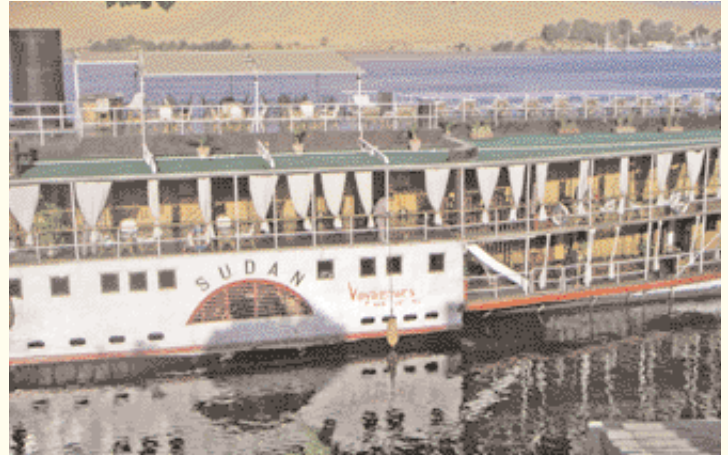
El barco Sudan, en el que se filmó la película "Muerte en el Nilo".

الباخرة سسودان" التي صورت عليها قصة أغاثا كريستي "وفاة عند النيل".