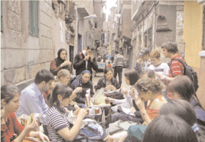
Té y falafel en una calle de el-Gamalia.