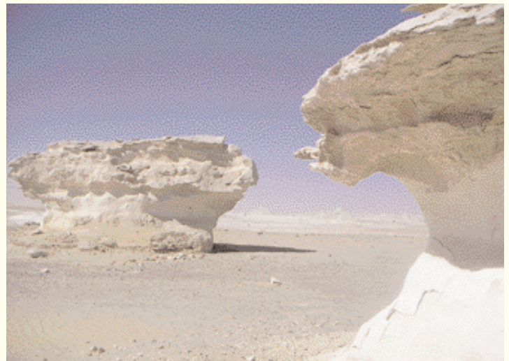
El desierto blanco.