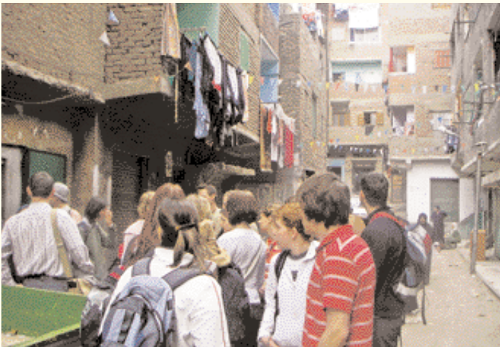
En el barrio Manshiat Naser.

الباخرة سسودان" التي صورت عليها قصة أغاثا كريستي "وفاة عند النيل".