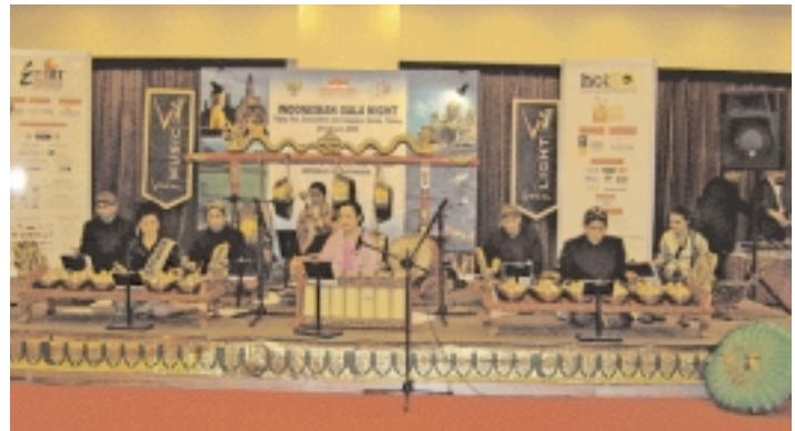
Grupo musical indonesio